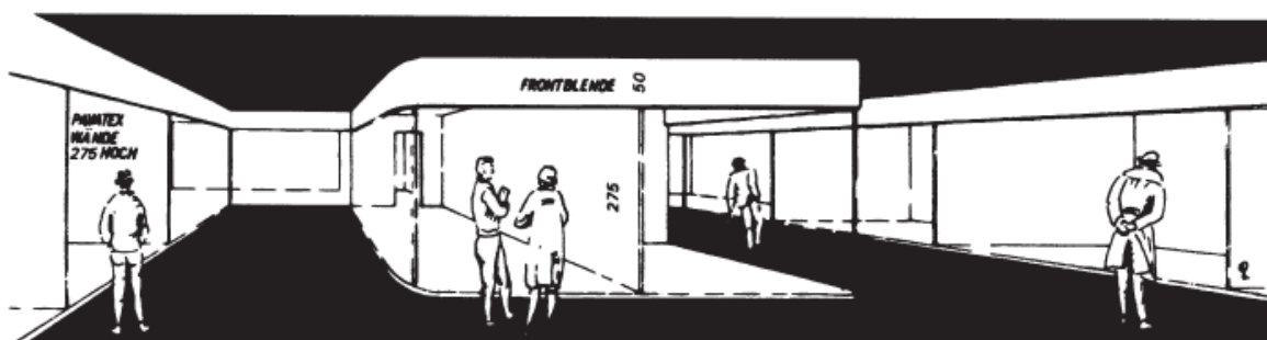
Schematische Darstellung der Stände.