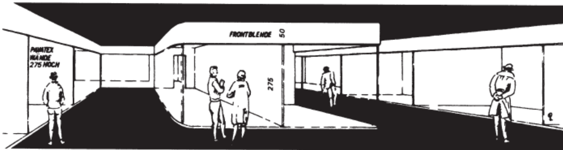
Schematische Darstellung der Stände.