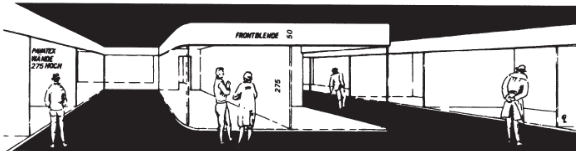
Schematische Darstellung der Stände.