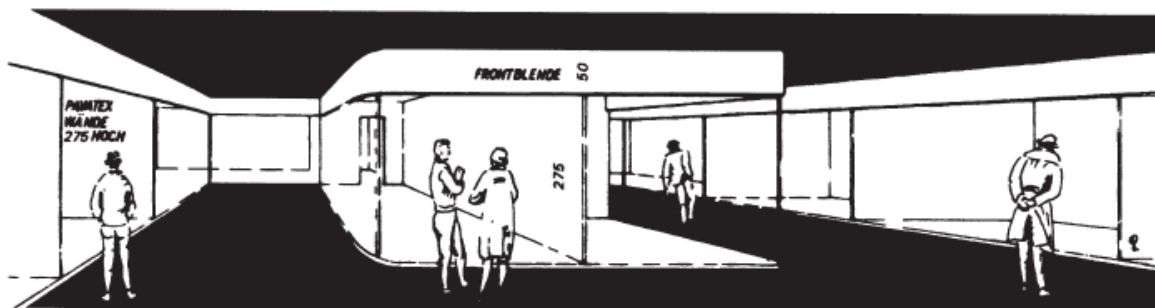
Schematische Darstellung der Stände.