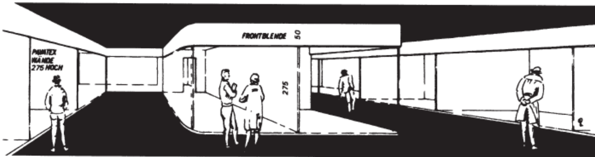
Schematische Darstellung der Stände.